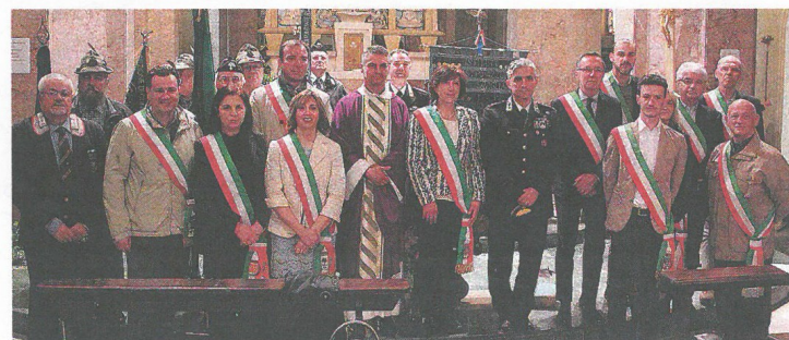
All'evento partecipano Carabinieri, autorità del territorio e associazioni d'arma

Venerdì scorso, 7 aprile, presso il santuario della Madonna della Sanità, si è celebrato il Precetto pasquale dell'Arma dei Carabinieri.